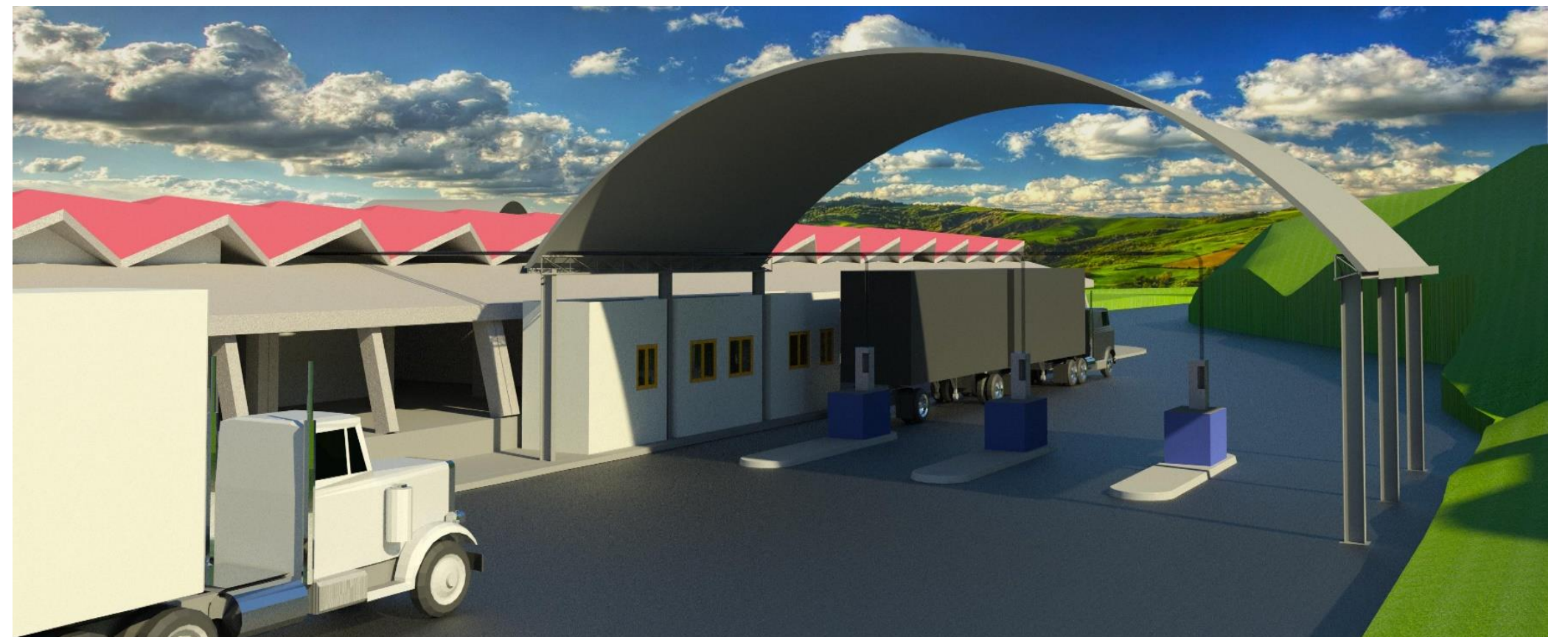
IMAGEN NOVIEMBRE 2018