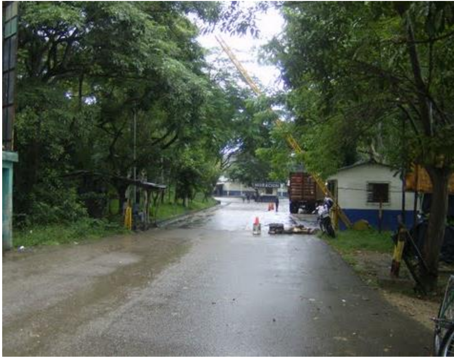
IMAGEN JULIO 2017